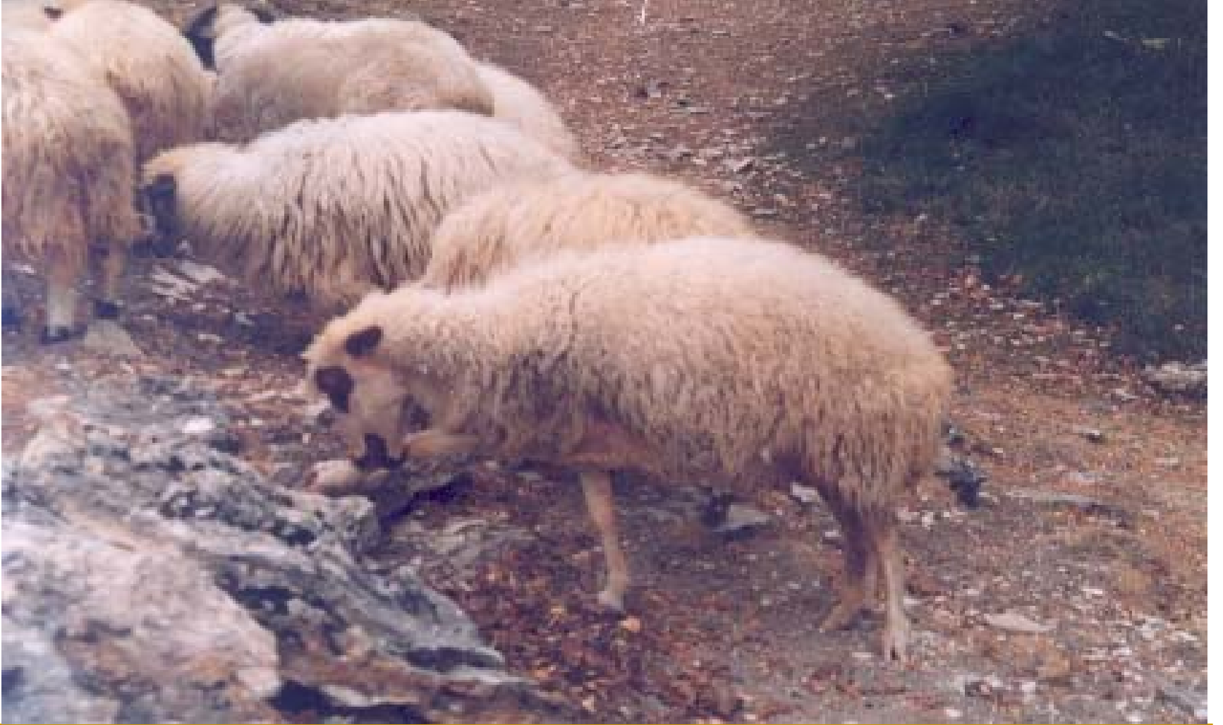
Dağlıç ırkı koyun sürüsü